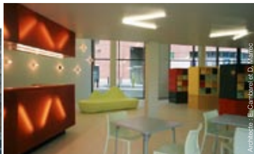
Architecte : E. Cambarelat, D. Marec

En accord avec les communes, l'AFTRP développe, en même temps que des programmes de logements (locatifs et en accession), des résidences étudiants, dans les quartiers bénéficiant d'une bonne accessibilité et de commerces de proximité.