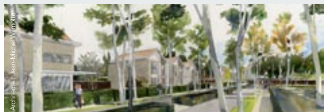
Wissous (91) - Les Meuniers