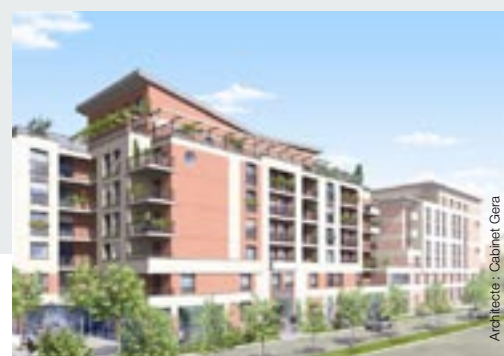
Evry (91) Communauté d'Agglomération «Evry Centre Essonne» Centre Urbain