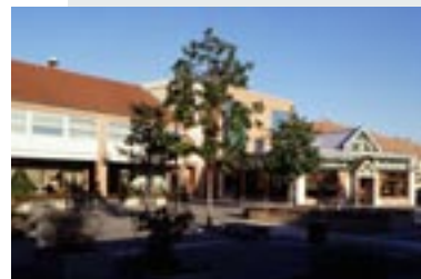
Rungis (94) - Les Antes

Pour contribuer à la re-dynamisation des centres urbains, l'AFTRP favorise l'implantation de petites et moyennes surfaces commerciales en pied d'immeuble, en cohérence avec la trame existante, pour permettre aux quartiers de se développer harmonieusement.