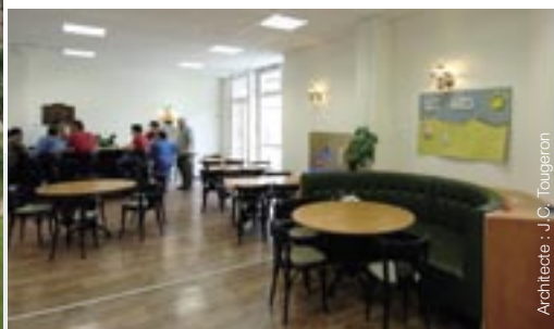
Architecte : J.C. Tougeron