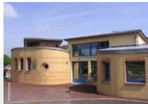
Architectes : Schmidt