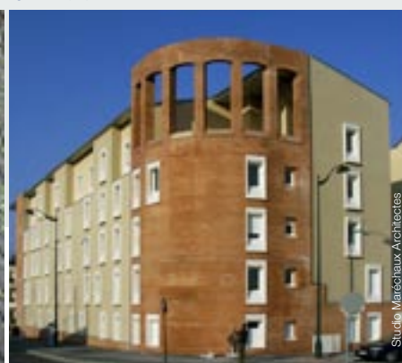
Carrières-sur-Seine (78) - Les Plants de Catelaine