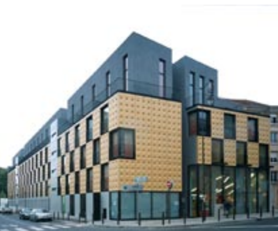
Argenteuil (95) - Carème Prenant