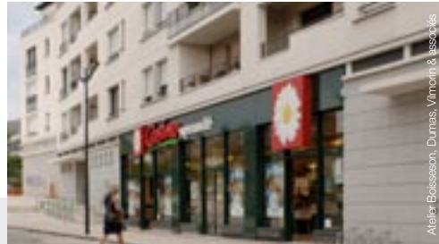
Saint-Cyr-l'École (78) - Centre-Ville

Au cœur d'Argenteuil, sur 3,3 ha, l'AFTRP a aménagé les terrains destinés à la réalisation d'une opération de recomposition urbaine d'envergure, comportant la réalisation d'un centre commercial de 20 000 m 2 de surfaces de vente, d'environ 300 logements locatifs et en accession ainsi que des hôtels et une résidence étudiants.