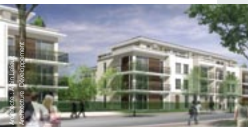
Architecte : Am Lalau Architecture Développement

Les prescriptions environnementales, relatives aux constructions et aux espaces publics, privilégient notamment l'utilisation de matériaux de qualité, durables, produits écologiquement (pierre, bois ...) et font une large place au végétal.