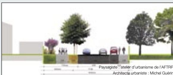
Paysagiste : atelier d'urbanisme de l'AFTRP Architecte urbaniste : Michel Guérin