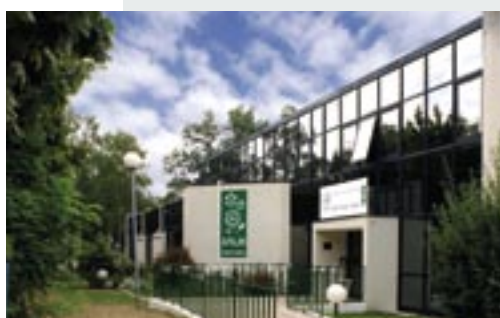
Taverny (95) - Les Châtaigniers - Centre d'Aide par le Travail

L'accueil des personnes atteintes de handicaps est concrétisé par la réalisation tant de structures d'hébergement que d'établissements sociaux et médicaux.