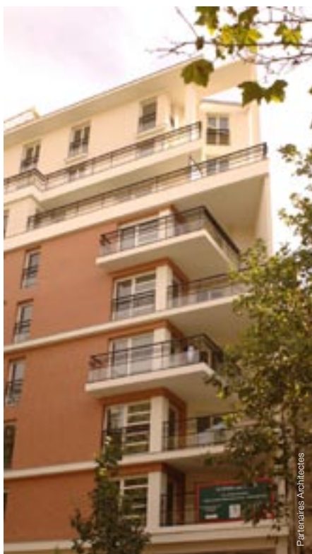
La Porte de Montrouge (92)