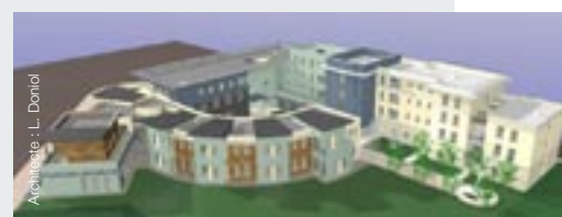
Architecte : L. Doniol

L'accueil des personnes atteintes de handicaps est concrétisé par la réalisation tant de structures d'hébergement que d'établissements sociaux et médicaux.