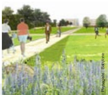
Paysagiste : Babylone

A Cormelles-en-Parisis (95), l'AFTRP réalise l'opération d'aménagement "Les Bois Rochefort" en cohérence avec la Coulée Verte (maîtrise d'ouvrage : Agence des Espaces Verts), qui devient tout à la fois un élément structurant du paysage, un espace public de loisirs et un véritable outil écologique de gestion des eaux pluviales.