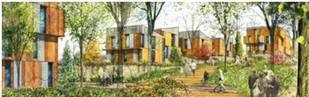
Architecte : Ignace Gille

A Cormelles-en-Parisis (95), l'AFTRP réalise l'opération d'aménagement "Les Bois Rochefort" en cohérence avec la Coulée Verte (maîtrise d'ouvrage : Agence des Espaces Verts), qui devient tout à la fois un élément structurant du paysage, un espace public de loisirs et un véritable outil écologique de gestion des eaux pluviales.