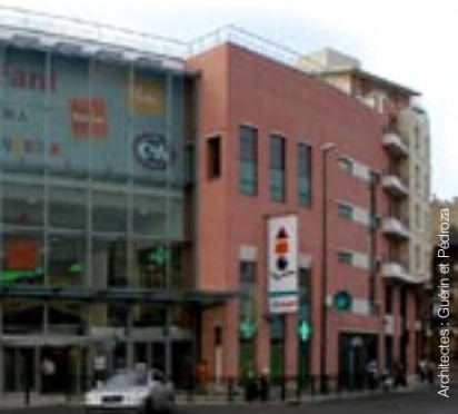
Argenteuil (95) - Carême Prenant

Au cœur d'Argenteuil, sur 3,3 ha, l'AFTRP a aménagé les terrains destinés à la réalisation d'une opération de recomposition urbaine d'envergure, comportant la réalisation d'un centre commercial de 20 000 m 2 de surfaces de vente, d'environ 300 logements locatifs et en accession ainsi que des hôtels et une résidence étudiants.