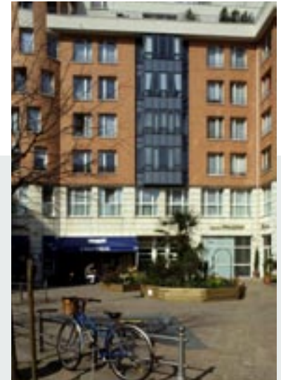
Bois-Colombes (92) - Lieu Original

Pour contribuer à la re-dynamisation des centres urbains, l'AFTRP favorise l'implantation de petites et moyennes surfaces commerciales en pied d'immeuble, en cohérence avec la trame existante, pour permettre aux quartiers de se développer harmonieusement.