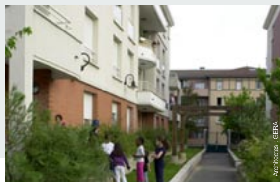
Saint-Ouen-l'Aumône (78) - Les Epluches