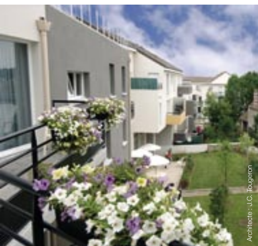
Architecte : J.C. Tougeron